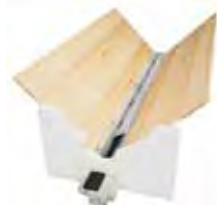
Vis de reprise de fond de silo