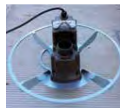
Système extraction taupe