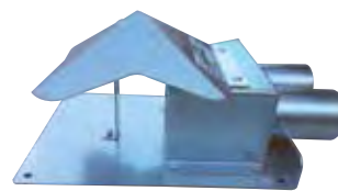
Collecteur de fond