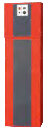
Système aspiration silo souple et rigide