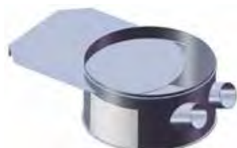
Bouche de reprise sous silo textile